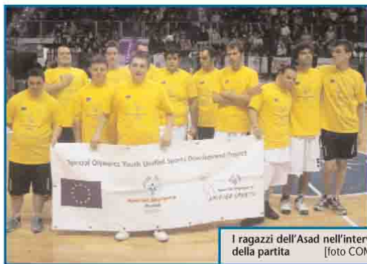
I ragazzi dell'Asad nell'intervallo della partita

Domenica nell'intervallo una bella partita dimostrativa