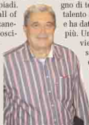
Quest'anno raggiungere la salvezza

■ Ottorino Flaborea: una leggenda del basket italiano. Lo dicono le cifre: 129 presenze in Nazionale, 4 scudetti, 3 Coppe dei Campioni, un bronzo europeo e tre partecipazioni alle Olimpiadi. Lo testimonia il suo ingresso nella Hall of Fame della federazione italiana pallacanestro: «Un onore ricevere questo riconoscimento ed essere al fianco di atleti come Menghin, Recalcati, Ossola». «Capitan Uncino» però non dimentica Biella e non smette di seguire le vicende del basket biellese: «Adesso mi trovo in Veneto. L'Angelico? Non sono ancora riuscito a vederla quest'anno ma conto di farlo presto».